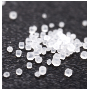
Kristaller av vanligt koksalt är kubiska.

Tips; vatten och salt ska helst vara så rena så möjligt. Föroreningar och damm stör kristallbildningen och gör så att det bara blir små kristaller.